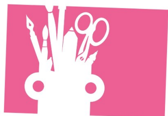
ILLUSTRATORS EXHIBITION 2024

Innanzitutto la Mostra Illustratori , tra le iniziative più longeve e di successo della fiera, nata nel 1967 come vetrina per scoprire e dare risalto ogni anno al meglio dell'illustrazione mondiale. La mostra ha accompagnato nei decenni l'evoluzione del mondo del libro per ragazzi, seguendone e individuandone le dinamiche creative. Sono stati 3520 gli illustratori candidati per la Mostra Illustratori 2024, per un totale di 17.600 tavole inviate da 81 Paesi e regioni del mondo.