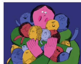
WHEN EVERYTHING MATTERS

When Everything Matters , ispirata al tema centrale dell'11° International Book Arsenal Festival, "The Migration Period", presenta nuove opere di importanti illustratori e grafici ucraini.