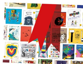
THE BRAW AMAZING BOOKSHELF 2024

La mostra The BRAW Amazing Bookshelf presenta una selezione di 100 libri candidati al premio Bologna Ragazzi Awards, esposta in un allestimento scenografico e a disposizione dei visitatori per essere sfogliati, letti e scoperti.