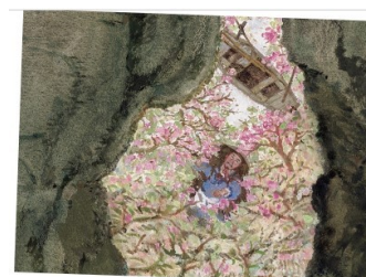
CHINESE EXCELLENCE IN CHILDREN'S ILLUSTRATION 2024

La mostra Chinese Excellence in Children's Illustration è un'ampia panoramica dell'illustrazione cinese contemporanea, fornendo alla comunità mondiale una comprensione più profonda dell'immenso patrimonio culturale di questo Paese.