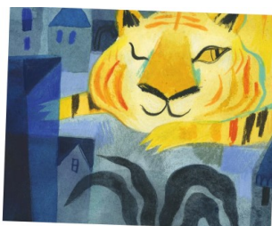
THE ORIGINAL ART

La mostra The Original Art , ospita illustrazioni dei migliori libri per bambini dell'anno pubblicati negli Stati Uniti ed è promossa dalla Society of Illustrators di New York, le opere vengono selezionate da una giuria composta da illustratori, direttori artistici ed editori di libri per bambini. A Bologna, per la prima volta una selezione di 48 opere tratte dall'edizione 2023 della mostra, e una serie di attività tenute da alcuni degli espositori.