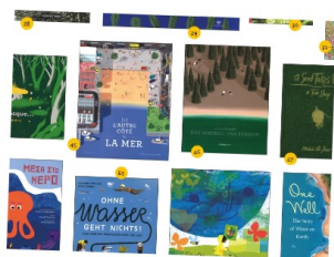
READING FOR A HEALTHY PLANET

Reading for a Healthy Planet: Inspiring Children's Books to Help Achieve a Sustainable Future è una mostra che amplia la riflessione sulla sostenibilità portata avanti anche nei due panel frutto della partnership, affiancandoli con una selezione di alcuni dei migliori libri sul tema, in un richiamo diretto ai Sustainable Development Goals delle Nazioni Unite.