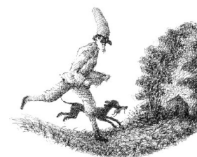
MAURO EVANGELISTA. VISIONS.

Dovuto il tributo al raffinato artista a Mauro Evangelista , per oltre vent'anni stretto collaboratore della fiera, a pochi mesi dalla scomparsa. La rassegna presenta oltre ottanta opere significative che ne illustrano il percorso artistico dagli esordi.